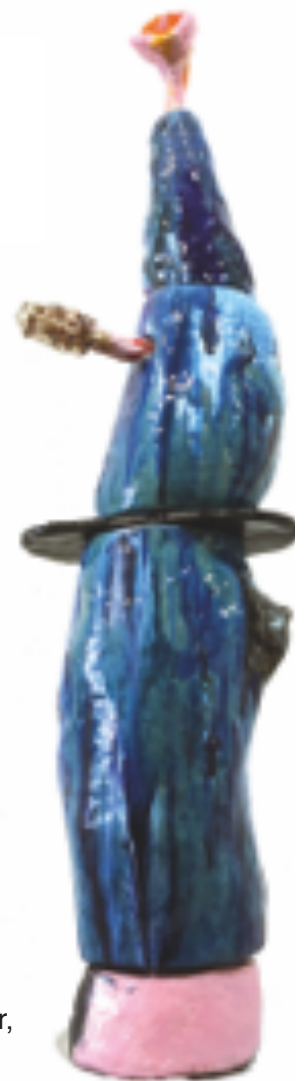
„Quellbereich“ Keramik/Glasur, 2.400 Euro