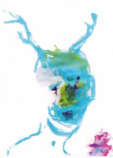
Aus der Serie „Haut um's Hirn“, „feel free“ 100 x 70 cm Eitempera, Acryl, Tusche auf Papier 1.200 Euro