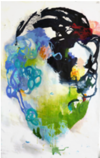
Aus der Serie „Haut um's Hirn“, „Seeblick“, 300 x 160 cm Eitempera, Acryl, Tusche auf Leinwand 4.800 Euro